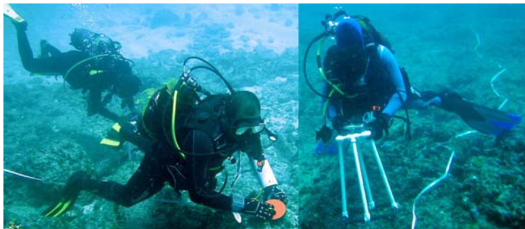
Underwater visual census transects (UVC) of fish density through substratum photo-quadrat recording of benthic coverage.