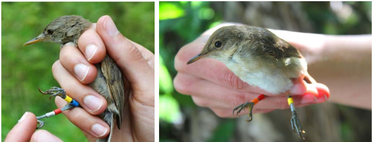
Adult (left) and juvenile (right) Cape Verde warbler Acrocephalus brevipennis with colour rings.